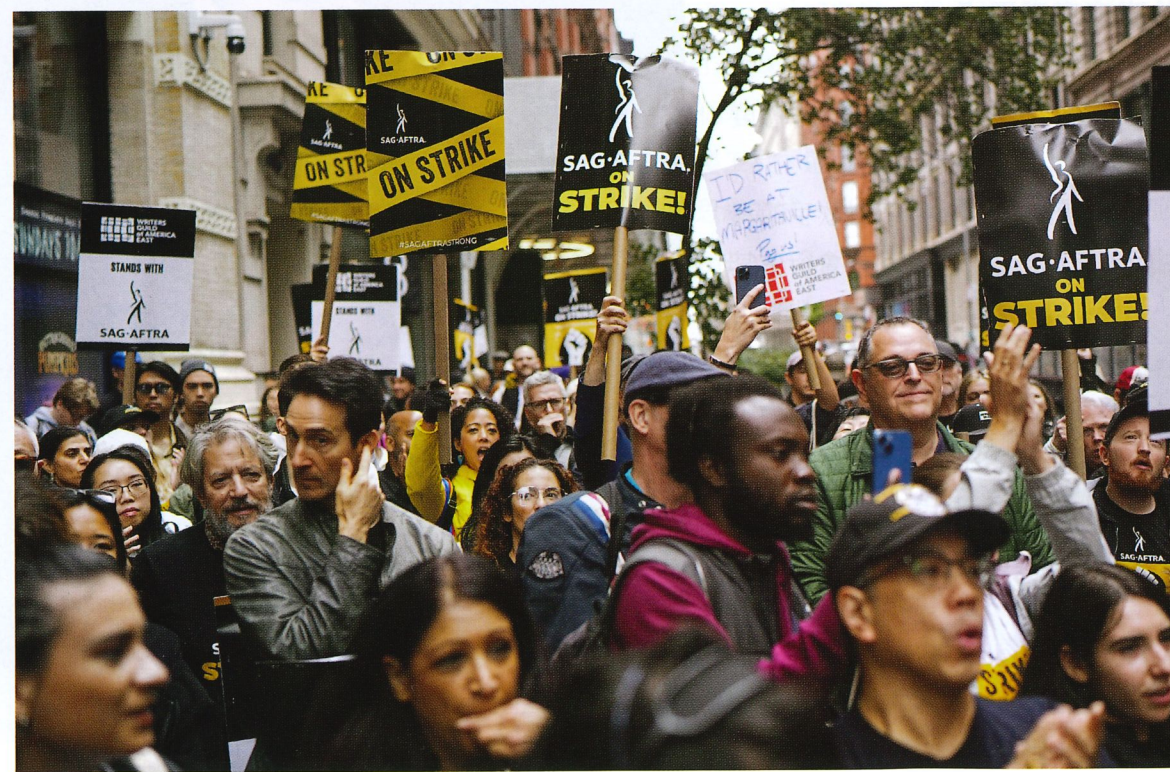
自 5 月，荷里活編劇工會發起集體罷工近五個月，直到 9 月底才與電影公司談判結束。

以 AI 引發深刻變革不僅在音樂產業中，它已經波及到影視行業。自 5 月，荷里活編劇工會發起了集體罷工近五個月，直到 9 月底才與電影公司談判結束。