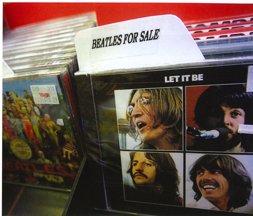
The Beatles 其中一位成員 Paul McCartney 透露，現正利用 AI 技術，來重現已故團員 John Lennon 和 George Harrison 的聲音，並讓自己的聲線聽起來更年輕。